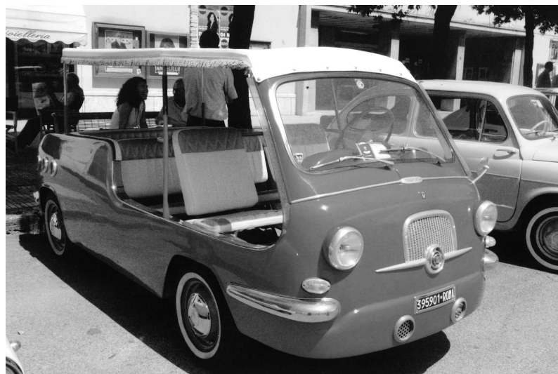
"Multipla tipo Fissore" al Raduno di Sabaudia

Alle 18 con l'intervento del presidente nazionale del Club Salvatore Torre, delle varie autorità presenti e con la consegna degli omaggi ai partecipanti si è conclusa una manifestazione davvero ben riuscita.